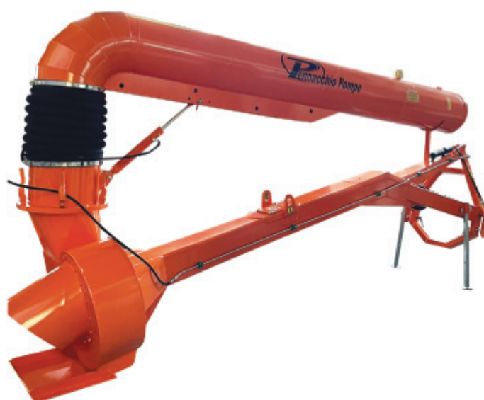
Pompe série TP manuelle avec piston

Possibilité d'installation transmission à bain d'huile