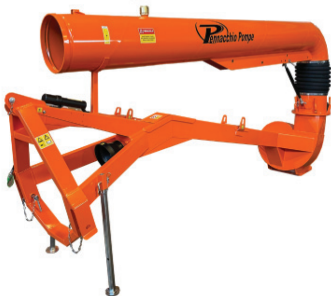
Pompe série TP manuelle