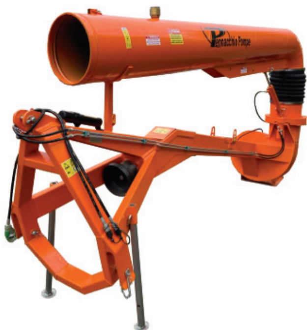
Pompe série TP hydraulique